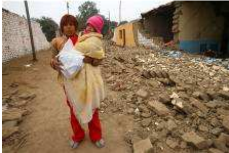
Dans ce journal compte rendu Opération Pisco Tremblement de terre 15/08/2007

Pérou Amitié Solidarité Le Village 07170 Saint Andéol de Berg 04 75 94 33 61 www.perouamitiesolidarite.org perouamitiesolidarite@cegetel.net